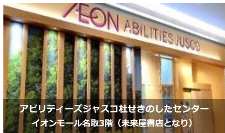
アビリティーズジャスコ社せきのしたセンター イオンモール名取3階（未来屋書店となり）

障がい者就労等相談コーナーおよびこころの健康相談コーナーにお申込み頂いたお客さまは、上記の場所までお越しください。 ※プライバシー配慮の観点から、上記の場所にて対応させていただきます。