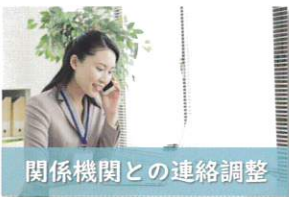
関係機関との連絡調整