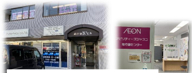
▲南行徳センター外観 (K2ビル)